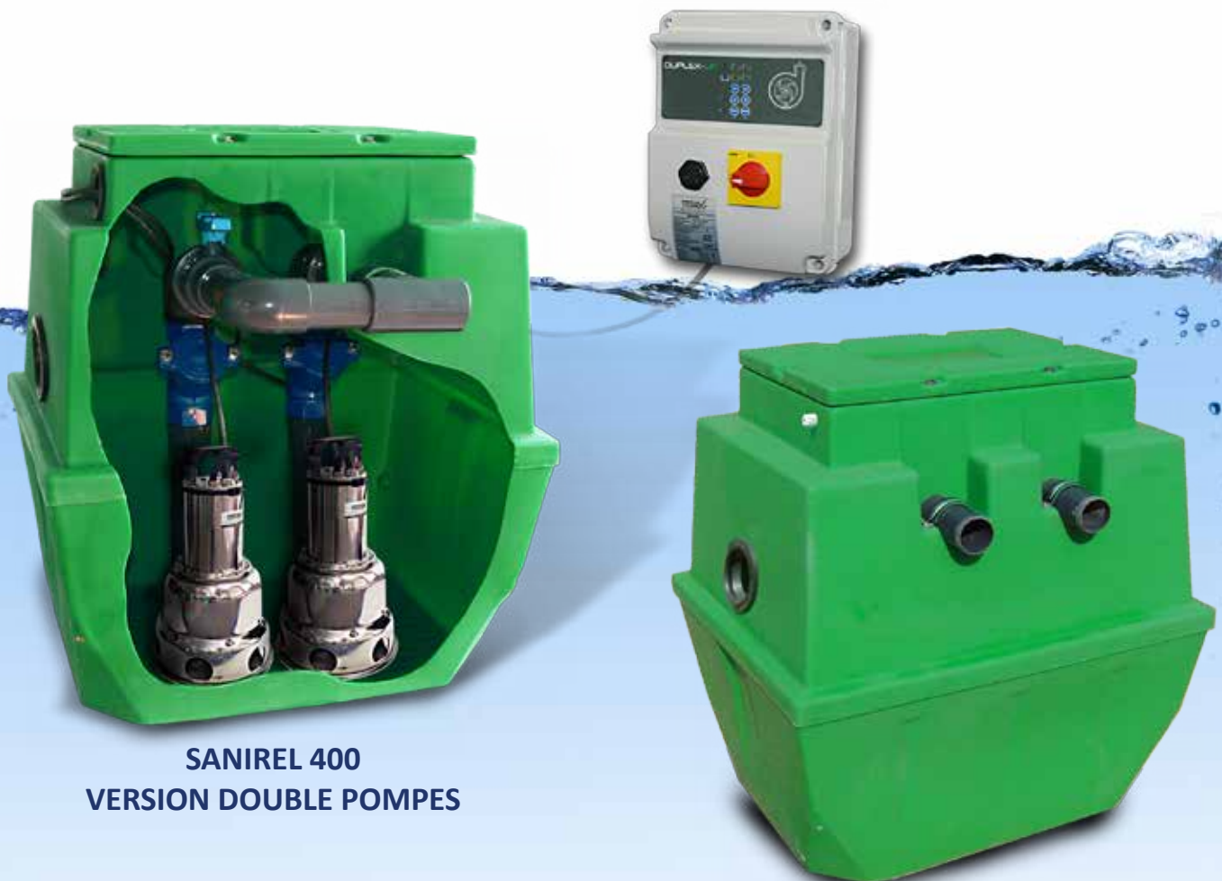
SANIREL 400 VERSION DOUBLE POMPES